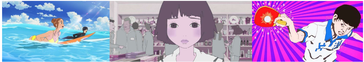
Masaaki Yuasa: Ride Your Wave, Mind Game & Ping Pong