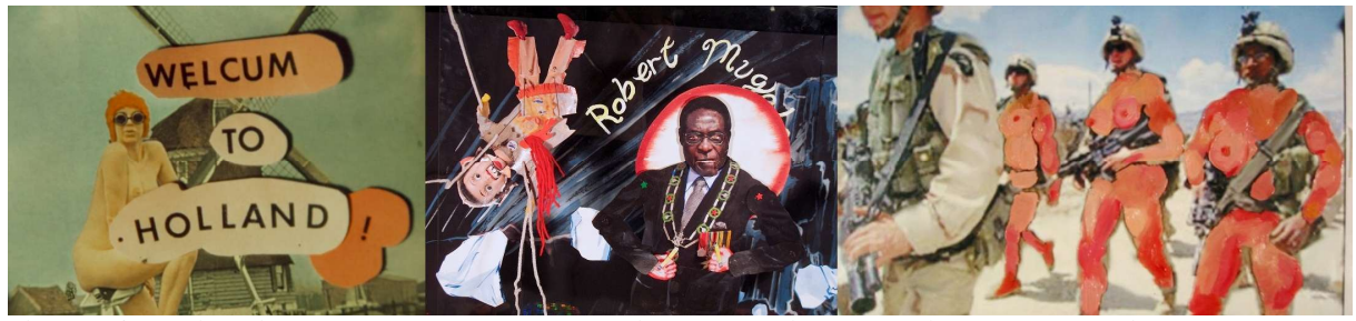
Triumph of the Wild (Cine-concert Martha Colburn): A Little Dutch Thrill, Dolls vs Dictators & Cosmetic Energy